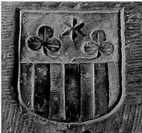
Foekema wapen út 1618

De twa klavers yn it wapen fan Folsgeare binne net nij mar binne oernommen fan'e grêfstiennen fan de Foekema's. De klavers steane op de grêfstiennen út 1618 en 1661. Yn 1511 binne der trije Foekema pleatsen yn Folsgeare en neiteam hjirfan is yn'e tsjerke fan Folsgeare begroeven. Yn 2002 binne twa grêfstiennen weron fûn. Dizze steane yn houten kistkes yn'e tsjerke dêr't se te besjen binne. ( sjoch finster: de Grafstenen van de Foekema's)