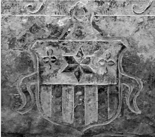
Foekema wapen út 1661