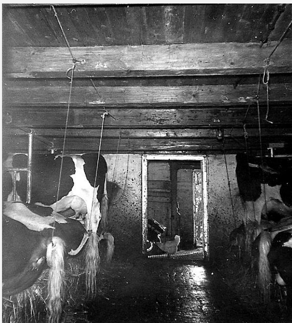
De stal van de pastorieboerderij